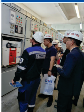
Аксуская электростанция, АО «ЕЭК»